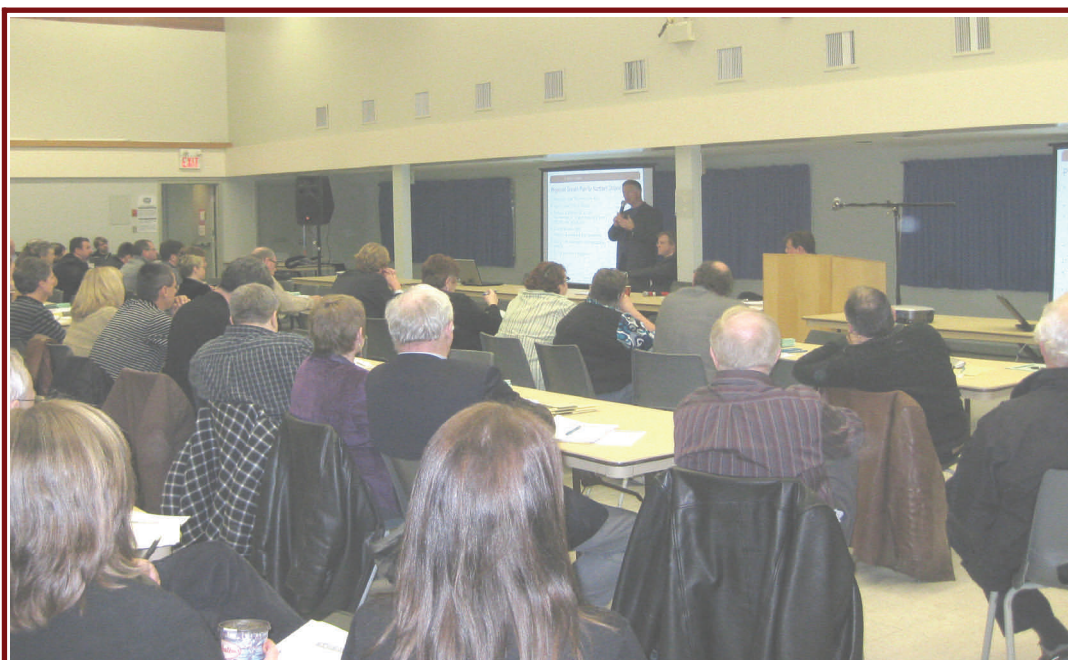
Les participants d'une séance d'exploration tenue à l'automne 2009 à North Bay ont examiné certaines des idées proposées dans l'ébauche du Plan de croissance. Une fois finalisé, cet audacieux plan de 25 ans aidera à tracer à un nouveau plan de route pour le Nord.